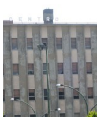
IL CENTRO SOCIALE L'edificio