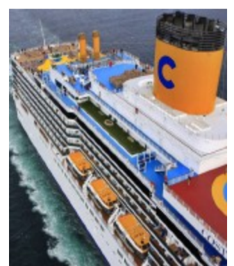
LA NAVE Costa Luminosa